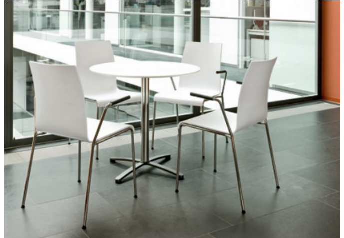
Vielseitige Einsatzbereiche. prime passt zu vielen Situatio- nen – und ist auch ein souveräner Partner für die kleine Runde.