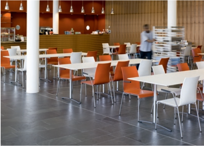
Pausenplatz: prime in der Kantine des Messtechnik- Unternehmens Endress+Hauser, Weil am Rhein.