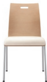
1090 mit Griffloch 5