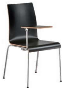
1090 mit Schreib- tablar