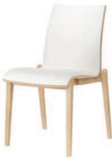
6802 durchgehendes Polsterdoppel