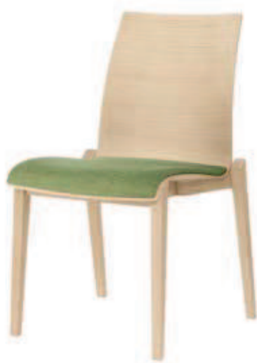
6802 Sitzpolster- doppel